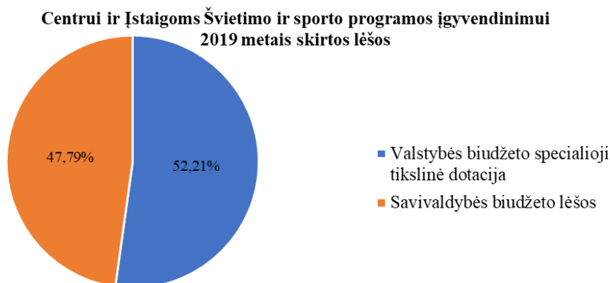
1 pav. Švietimo ir sporto programos įgyvendinimui 2019 metais skirtų lėšų procentinė sandara.

Valstybės biudžeto specialioji tikslinė dotacija sudarė 8 315 949,89 Eur, iš jų Mokymo lėšos – 8 227 349,89 Eur (2018 m. – 7 774 926,50 Eur), 48 000 Eur specialioji tikslinė dotacija Savivaldybės mokykloms (klasėms), šalies (regiono) mokiniams, turintiems specialiųjų ugdymosi poreikių ir 40 600 Eur – formalųjį švietimą papildančio ugdymo programoms finansuoti. Valstybės biudžeto lėšos sudarė 52,21 proc. viso Švietimo ir sporto veiklos programai įgyvendinti Centrui ir Įstaigoms skirto asignavimų plano (2018 m. – 52,61 proc.).