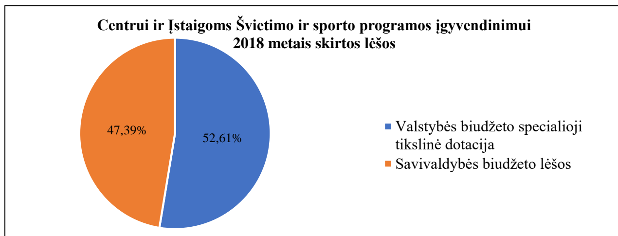
1 pav. Centrai ir Įstaigoms Švietimo ir sporto programos įgyvendinimui 2018 metais skirtų lėšų procentinė sandara

Švietimo ir sporto veiklos programai įgyvendinti Centrai ir Įstaigoms 2018 metais skirta 15 077 646,50 Eur (2017 m. – 14 494 493,70 Eur). Lėšų procentinė sandara pavaizduota 1 paveiksle.